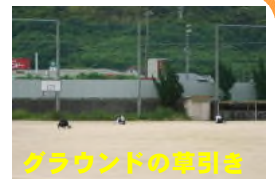
グラウンドの草引き

各委員会では朝の活動も行っています。執行部は学校前の歩道と中央廊下で挨拶活動を、体育委員会はグラウンドで草引きを、生活委員会と環境委員会は玄関や下足室の清掃と挨拶活動に取り組んでいます。これらの活動により、美しい環境で、気持ちのよい一日を始められています。