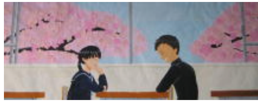
↑中央廊下に掲示された美術部作成のロングポスター